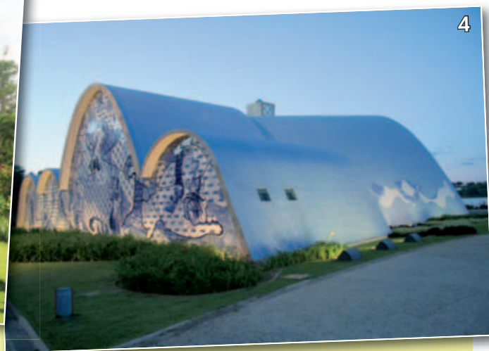
Figura 4 - Igreja de São Francisco de Assis, na Pampulha.