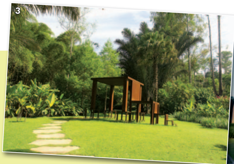
Figura 3 - Museu Inhotim.