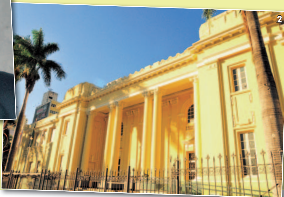
Figura 2 - MINASCENTRO, sede do evento.