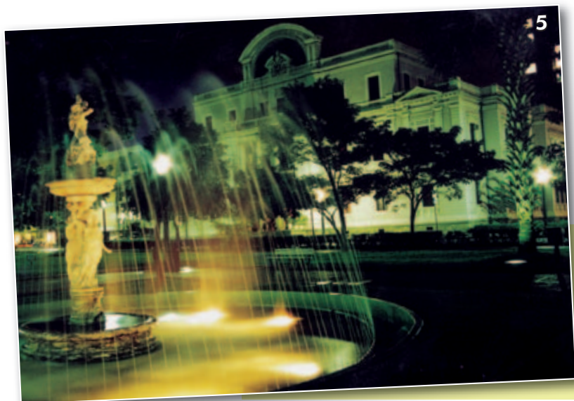
Figura 5 - Praça da Liberdade.

A hospitalidade da capital mineira estará refletida no empenho e no entusiasmo da comissão organizadora em receber todos aqueles que estejam em busca de atualização consistente e fundamentada em evidências científicas.