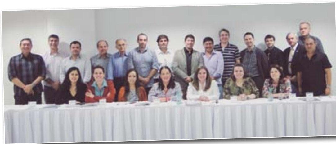
Membros da ABOR reunidos durante a Assembleia Geral.