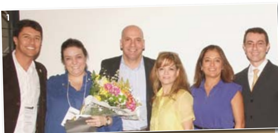
Figura 1 - Diretoria da Sociedade Brasileira de Ortodontia (SBO).

No dia 12 de julho foi difícil eger de qual atividade científica participar.