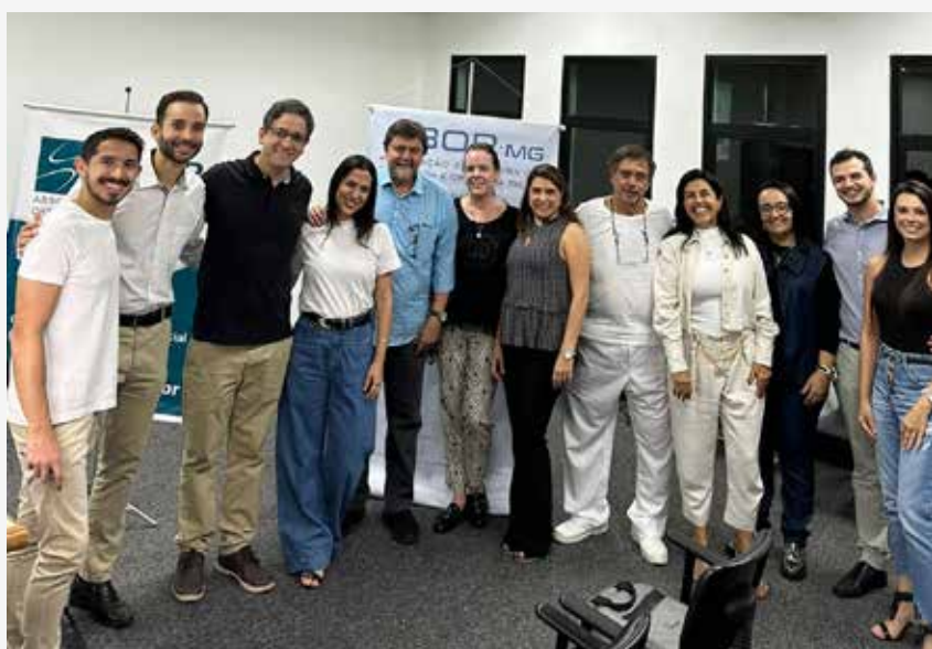
↑ Discussão de Caso Clínico – Faculdade de Ciências Médicas