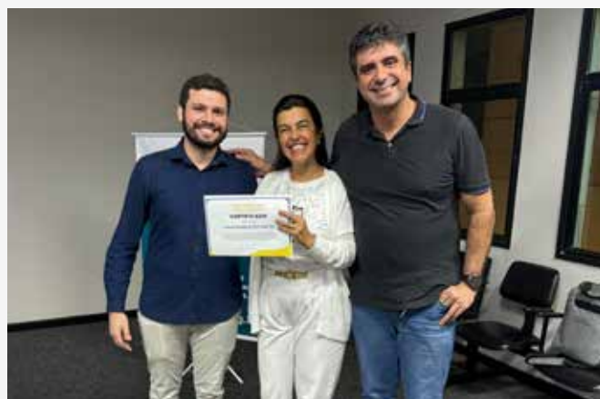
↑ Discussão de Caso Clínico UFMG.