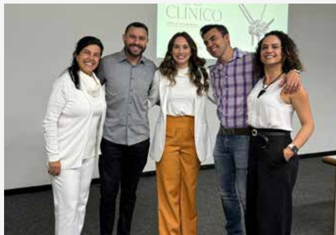
↑ Discussão de Caso Clínico FACSETE.