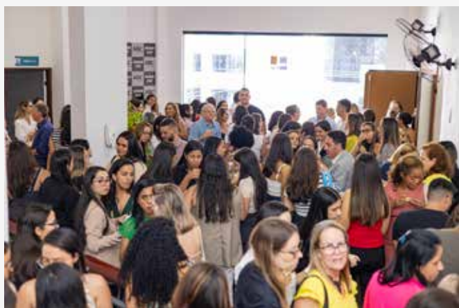
↑ Plateia durante evento científico e no intervalo das palestras.