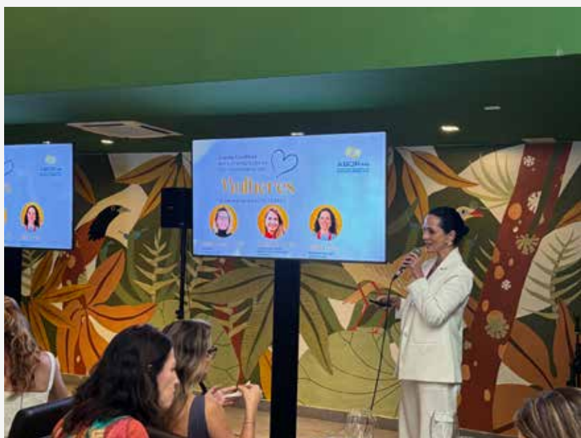
↑ Evento em comemoração do DIA INTERNACIONAL DA MULHER