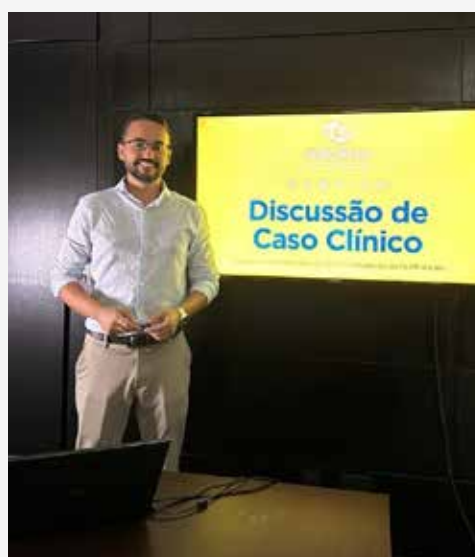
↑ Discussão Caso Clínico IES/BH.