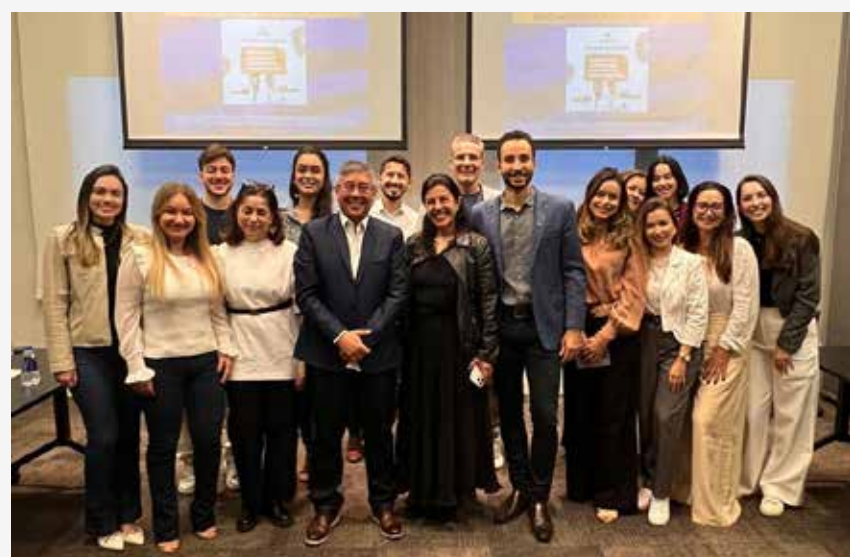
↑ Curso de Ancoragem Esquelética