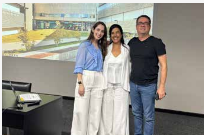
↑ Discussão de Caso Clínico PUC MINAS.