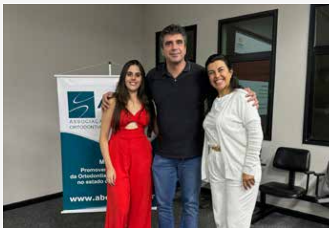
↑ Discussão de Caso Clínico UFMG.