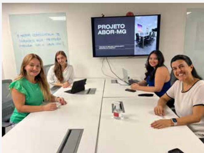
↑ Projeto SKEMA CONSULTORIA JUNIOR

Foi um grande ano, repleto de desafios e trabalho que chega ao fim com a certeza de que a dedicação e o esforço foram recompensados e cumprimos nossa missão de lutar por uma Ortodontia que prima pela ÉTICA e EXCELÊNCIA.