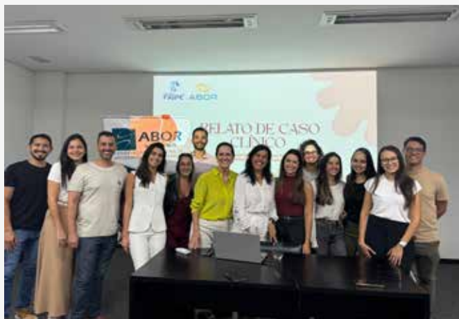
↑ Discussão de Caso Clínico IES.